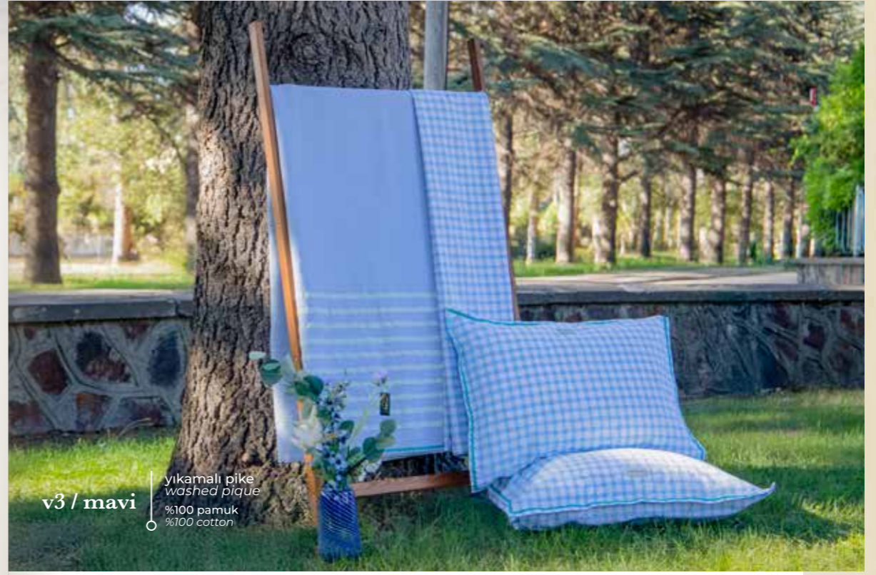
v3 / mavi yıkamalı pike washed pique %100 pamuk %100 cotton