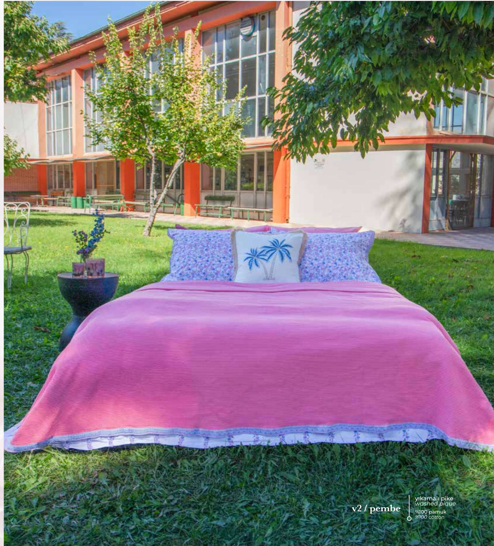
v2 / pembe yıkamalı pike washed pique %100 pamuk %100 cotton