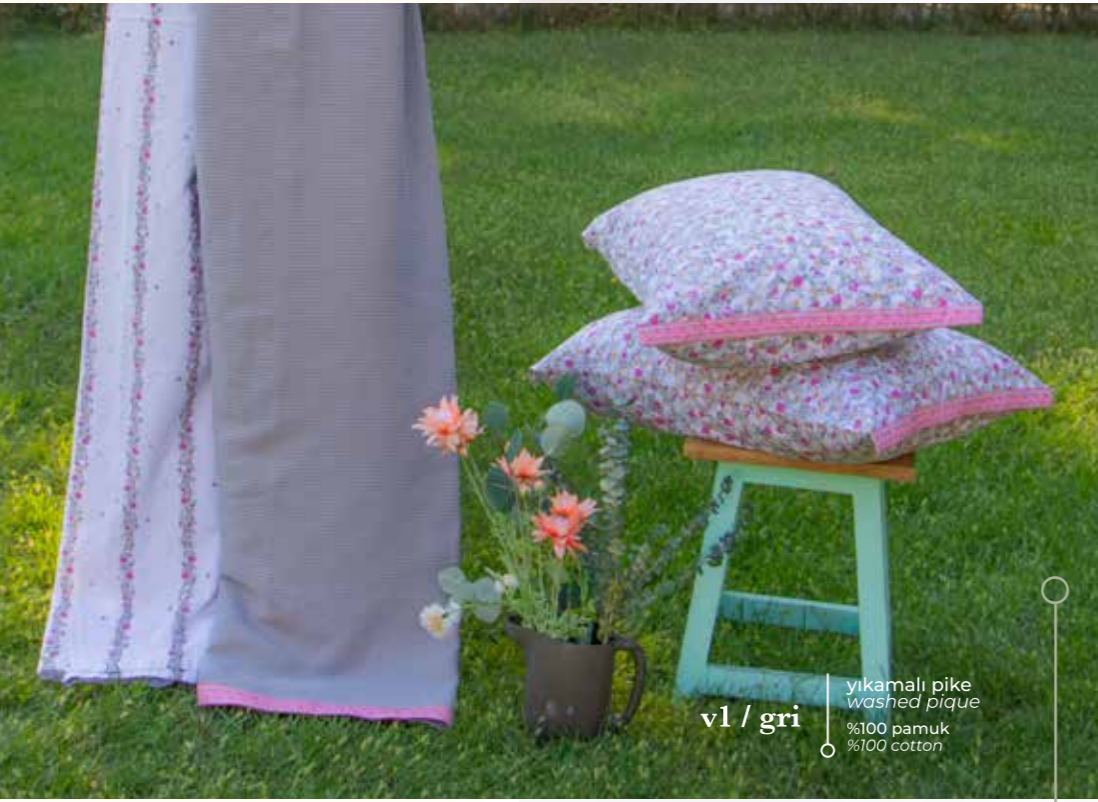
v1 / gri yıkamalı pike washed pique %100 pamuk %100 cotton