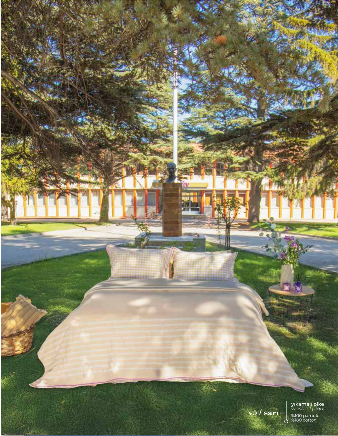
v5 / sarı yıkamalı pike washed pique %100 pamuk %100 cotton