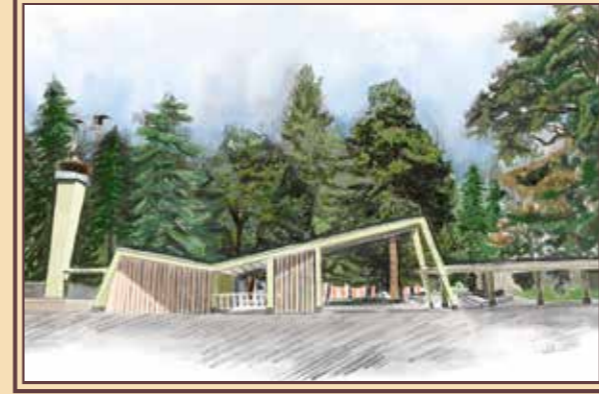
Çekirge (Ana Giriş) Yapısı