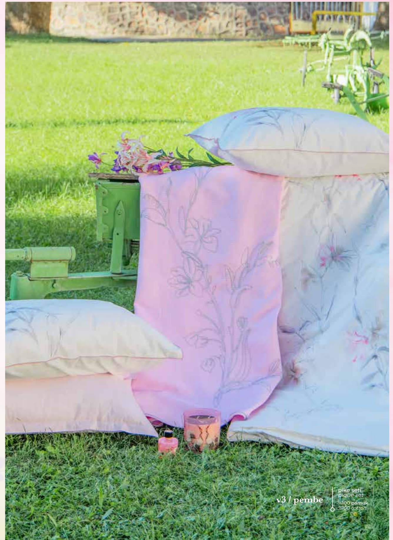
v3 / pembe pique seti pique set %100 pamuk %100 cotton