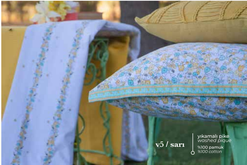
v5 / sarı yıkamalı pike washed pique %100 pamuk %100 cotton