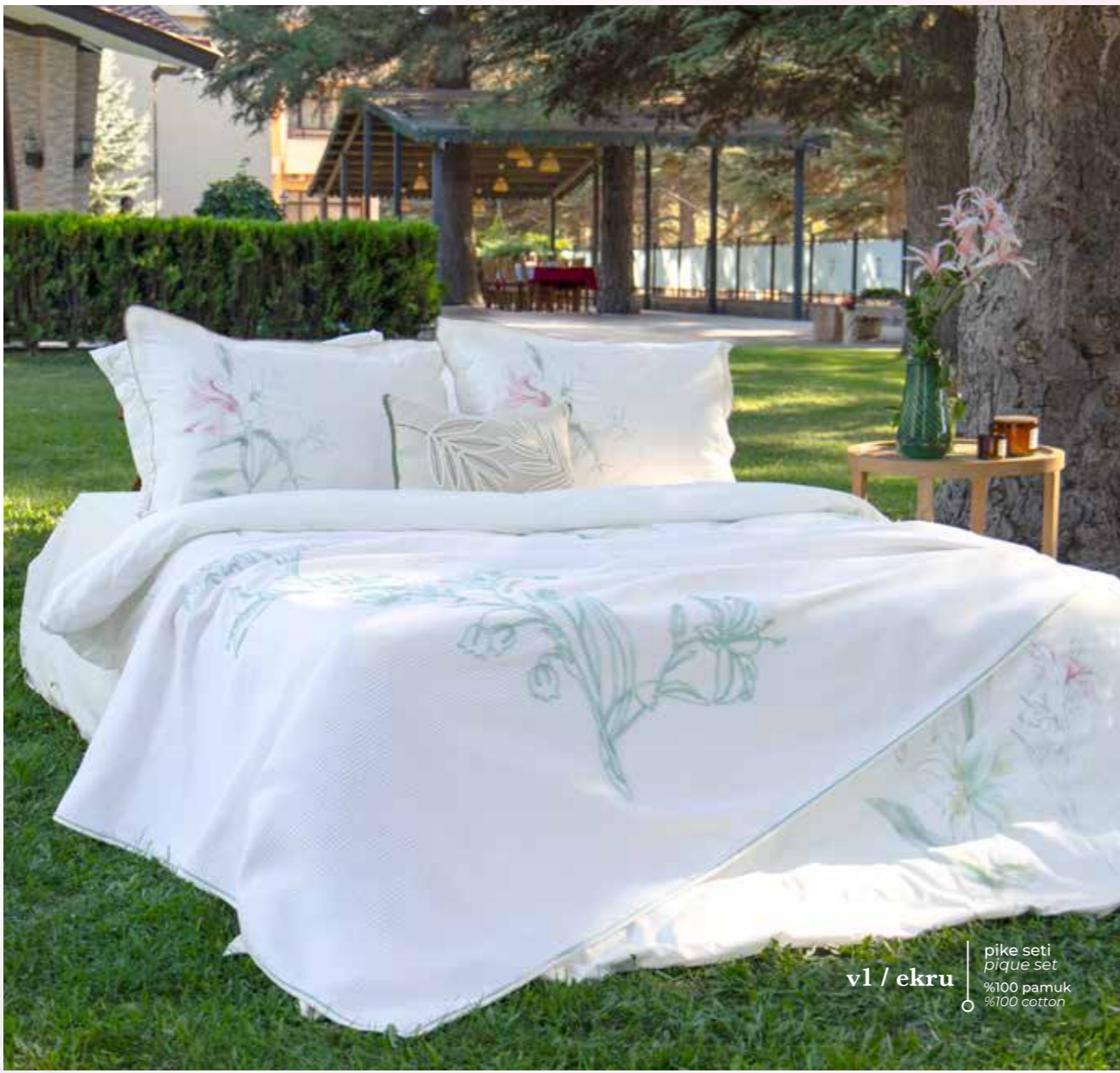
v1 / ekru pique seti pique set %100 pamuk %100 cotton