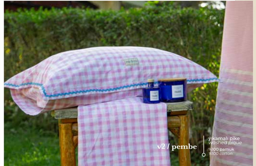
v2 / pembe yıkamalı pike washed pique %100 pamuk %100 cotton